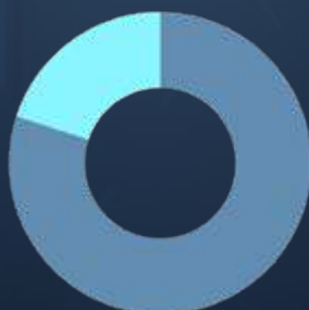
Profil Dynamique MONT-BLANC

La part actions peut varier de 50 % à 90 %