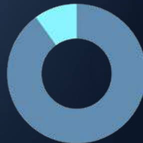
Profil Audacieux MONT EVEREST

La part actions peut varier de 60 % à 100 %