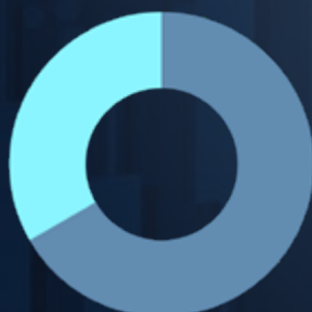
Profil Patrimonial MONT-FORT

La part actions peut varier de 25 % à 75 %